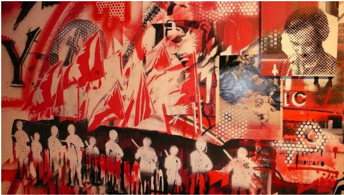
Imagen 14 (BsAs Stencil)